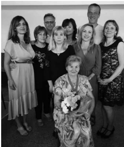
Učiteľka, herečka, speváčka, taneční-

ca, športovkyňa. Skromná, pokorná, citlivá, vždy usmiata, dobre naladená, priateľská, obetavá, mierumilovná a kedykoľvek ochotná pomôcť. Skrátka žena so „srdcom na dlani“.